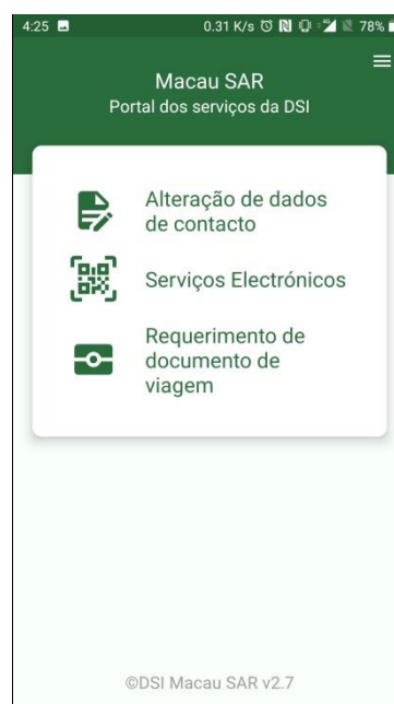
Aplicação móvel “Portal de Serviços da DSI” (Versão do sistema operacional Android)